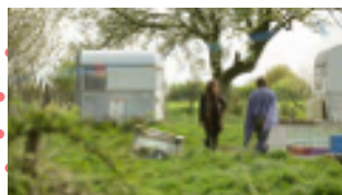
Les Pieds sur terre de B. Hagenmüller & B. Combret

Les droits des films sont négociés et les déplacements de cinéastes font l'objet d'une aide financière.