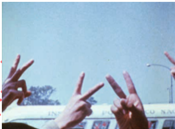
Le Fond de l'air est Rouge de Chris Marker © Iskra

Initiés cette année en partenariat avec la Procirep, ces parcours ont pour but de faire découvrir les différentes facettes de la production documentaire.