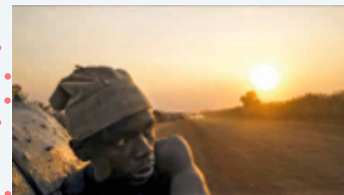
Makala d'Emmanuel Gras

4 cycles thématiques sur l'actualité culturelle et sociétale française ou francophone : « Portraits de cinéma », « Espaces de femmes », « La terre en héritage » et « En cuisine ».