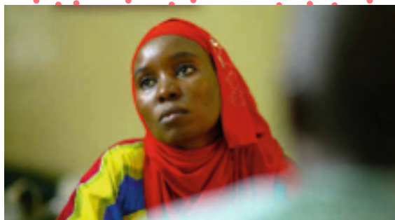
L'Arbre sans fruit d'Aïcha El Hadj Macky

Les producteurs et productrices seront disponibles pour se déplacer. Leurs transports seront pris en charge par Images en bibliothèques.